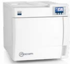
B Classic AUTOCLAVES