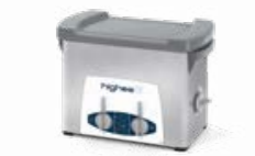
Highea 3 LAVADO